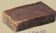
Vanille | Bruin Geur: Warm vanille