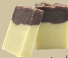
Golden milk / offwhite/bruin Geur: Neutraal met vleugje kaneel