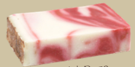
Rode klei | Roze Geur: Zeepgeur