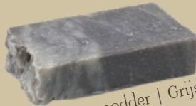
Dode zee modder | Grijs Geur: Zeepgeur