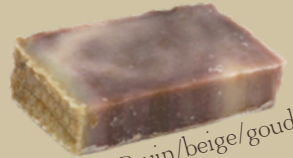
Propolis | Bruin/beige/goud Geur: Warm, honing