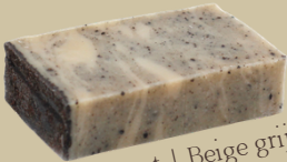
Kokosnoot | Beige grijs Geur: Kokos