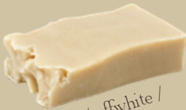
Melk / offwhite / Geur: neutraal